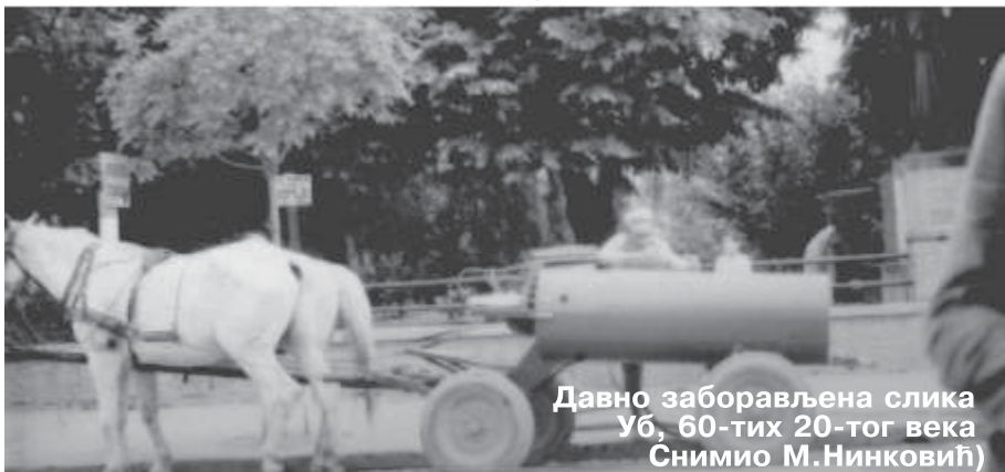
Давно заборављена слика Уб, 60-тих 20-тог века

Ето тако је било онда када је свирао бенд.