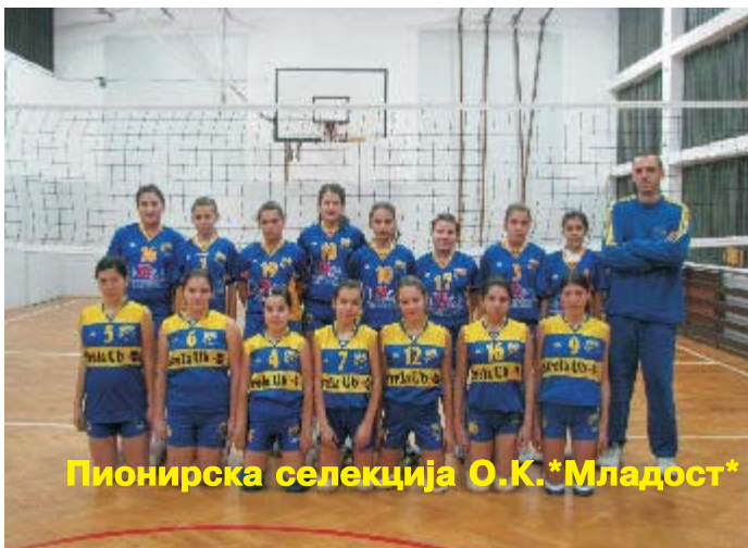
Пионирска селекција О.К. *Младост*