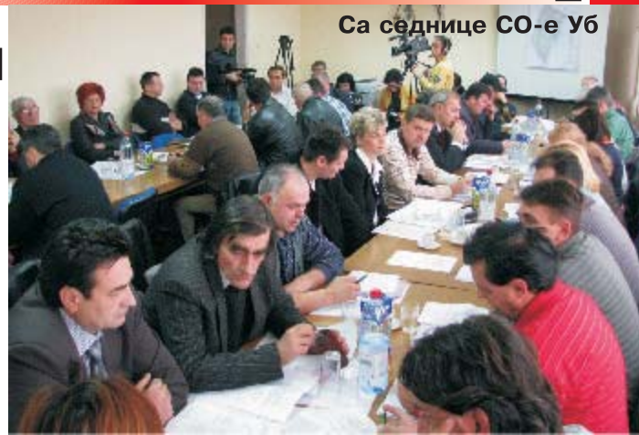
Са седнице СО-е Уб

Највећу пажњу на фебруарској седници локалног парламента привукла је дискусија која је вођена у оквиру Претреса предлога и доношење решења о давању сагласности Јавним предузећу "Дирекција за уређење и изградњу" Уб са Програмом пословања за 2009. годину.