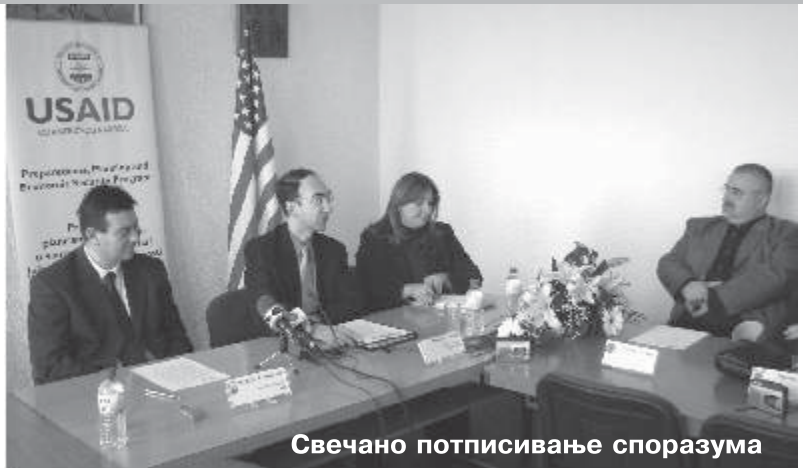
Свечано потписивање споразума

За суботу, 11. април 2009.г. заказана је, у Убу, изложба паса у организацији убског кинолошког друштва. Биће то, како сазнајемо, велика манифестација на нивоу Србије.