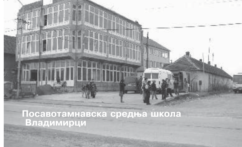
Посавотамнавска средња школа Владимирци

Владимирчка средња школа заиста служи за пример, а то што узима ђаке из околних општина је проблем средњих школа у тим општинама. Здрава конкуренција! Што дане?