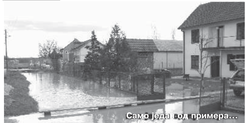
Само једна год примера...

Тамнава се у ноћи између суботе и недеље, 7. и 8. марта, излила па су били поплавлени и непроходни мостови у Брезовици и Новацима, као и велеки део земљишта под разним пољопривредним културама. Вода се у међувремену повукла, али је остао проблем, који ће, како поручују из локалне самоуправе, упркос кризним временима, бити решен - а то је регулација тока реке Тамнаве кроз убску општину.