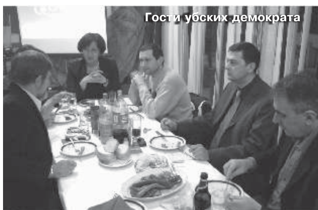
Гости убских демократа