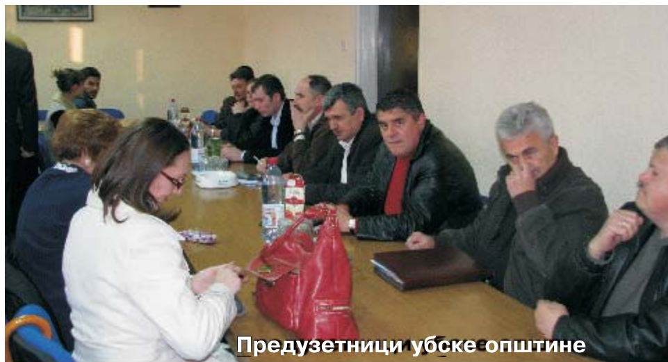
Предузетници убске општине

Иначе, следећи фестивал на којем редовно учествују убска деца из Вртића је "ДЕДАР 2009", из области дечјег позоришног и сценског стваралаштва, одржава се, такође у Смедереву, али у мају месецу, за када се деца и васпитачи већ увелико припремају јер су до сада освојили низ признања, па како кажу, не смеју дозволити да се обрुкају.