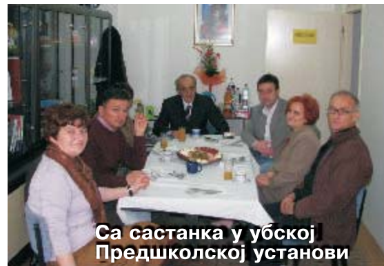
Са састанка у убској Предшколској установи

Убска предшколска установа била је домаћин састанка начелника за просвету Колубарског округа са директорима и представницима предшколских установа из околних општина. Договорено је да се конструктивна сарадња настави, а посебно је похваљен рад и резултати које постиже убски Дечији вртић. (Слика горе)