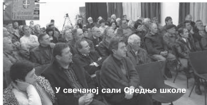
У свечаној сали Средње школе