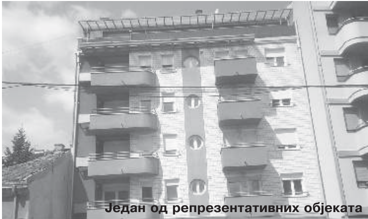
Један од репрезентативних објеката

Референца се стицала широм Србије, а највише у Београду, Ваљево и другим суседним градовима. Број радника се полако, али сигурно, повећавао, па је, са почетних 37, стигао до око 50 (у сезони и око 60), са тенденцијом раста упркос чињеници да је све мање инвеститора и све оштрија конкуренција.