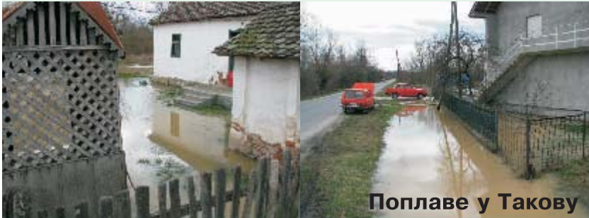
Поплаве у Такову

Обилне падавине, сем њива, угрозиле су и бунаре са пијаћом водом. Најмање 400 бунара је тотално неупотребљиво. Поједини су се излили на површину, од воде која је пристизала у њих. Те бунаре треба санирати. Почетну анализу и предлог урадиће Институт за јавно здравље из Ваљева. Штаб за одбрану од елементарних непогода је поделио 45 тона флаширане воде, Општина Уб је финансирала једну половину, а "Вујић" Ваљево је донирао другу. Дистрибуција те воде ишла је преко повереника у Месним заједницама. Санација бунара ће се радити чим будемо сигурни да се вода повукла на редован ниво.