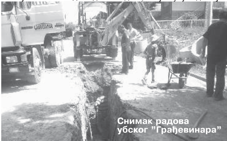
Снимак радова убског "Грађевинара"