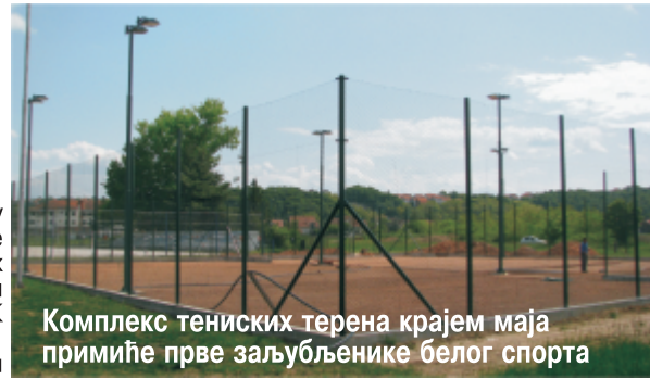
Комплекс тениских терена крајем маја примиће прве заљубљенике белог спорта