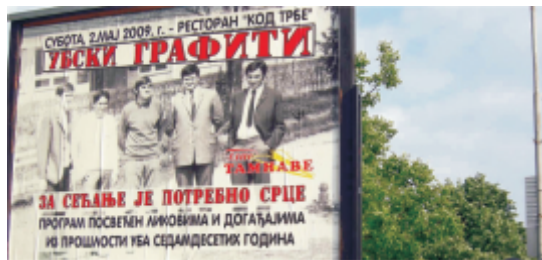
Зона, Џаја и две Весне

Иначе, у припреми за штампу је и књига ”Убски графит 2009.”