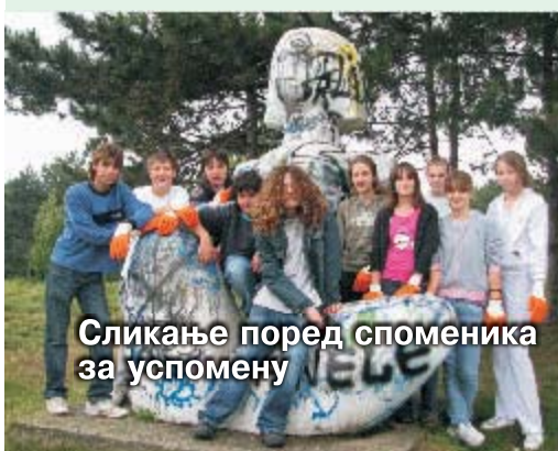
Сликање поред споменика за успомену