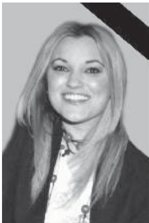
МАРИЈИ 7. мај 1983.