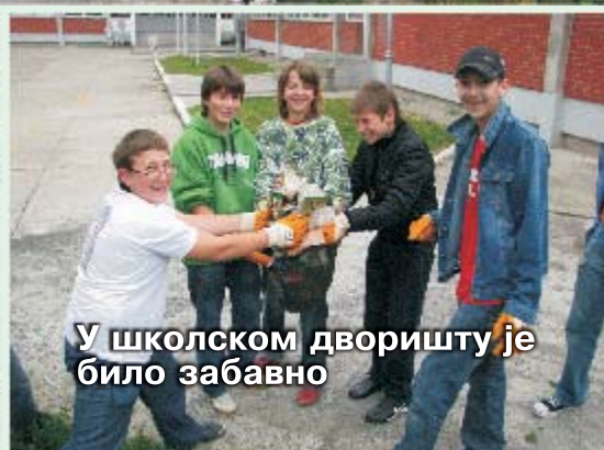
У школском дворишту је било забавно