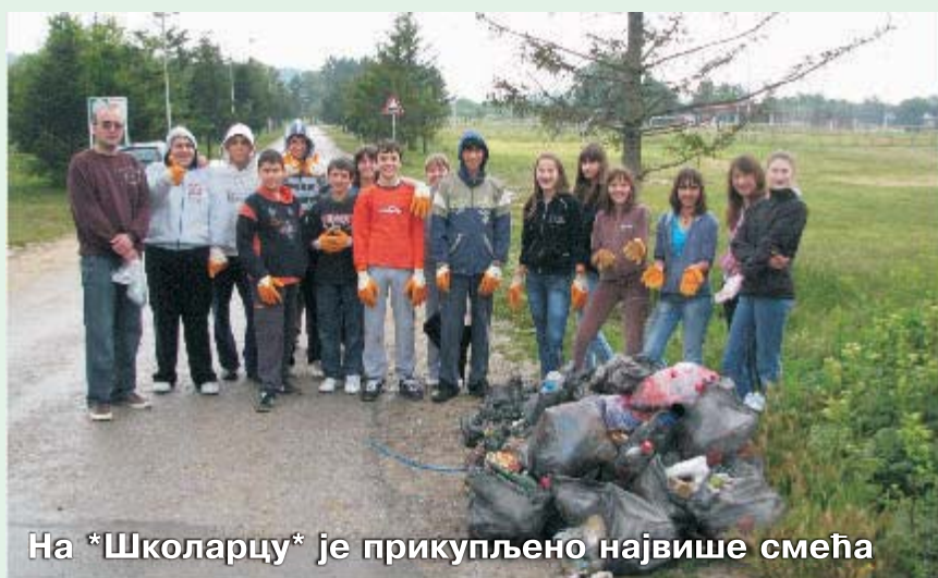
На *Школарцу* је прикупљено највише смећа