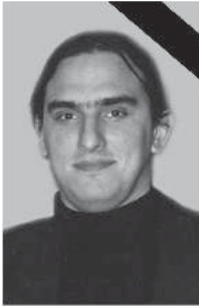
БОШКУ 18.децембар 1980.