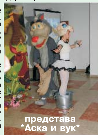
представа *Аска и вук*

*Другари, где ћемо оволико смеће?*- поручили су ученици ове манифестације и подстакли старије на размишљење.