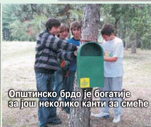
Општинско брдо је богатије за још неколико канти за смеће