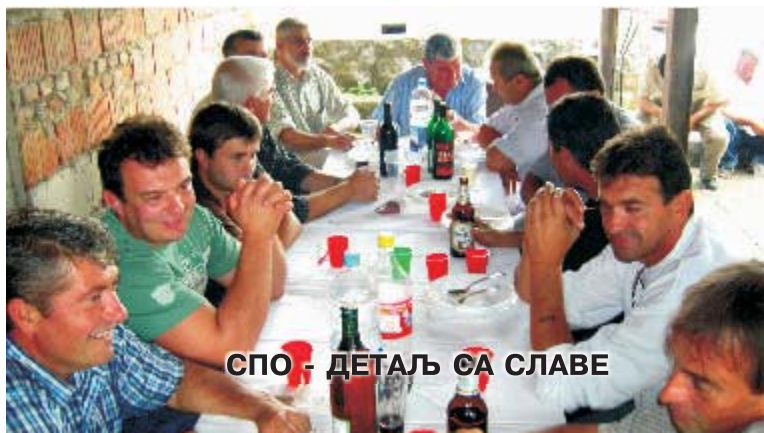
СПО - ДЕТАЉ СА СЛАВЕ

У Бањанима, у угоститељском објекту "МАГАЗА", ОО Српског покрета обнове прославио је, како то и доликује добрим домаћинима, своју славу - Видовдан. Посни, али богат ручак и лепо расположење били су само део сачуване традиције.