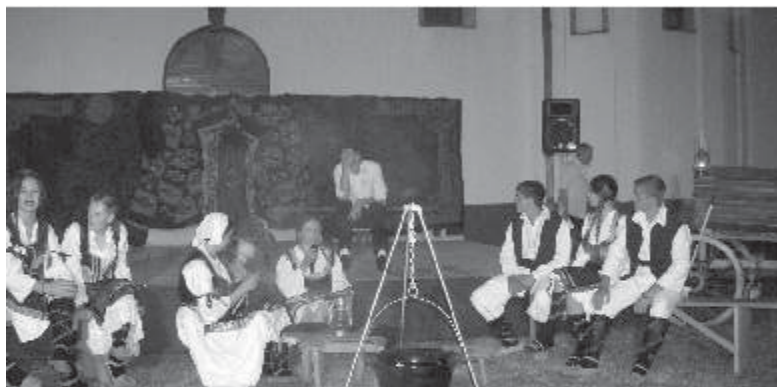
"Јанкови дани 2009." - Драмска секција Средње школе на "делу"

Деца из Предшколске установе *Полетарац* имала су 12. јуна завршну приредбу. Пред препуном салом Дома културе најмлађи Коцељевци су извели програм који је одушевио све присутне.