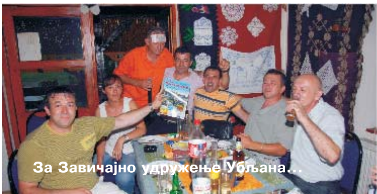
За Завичајно удружење Убљана...

Сусрет Убљана у Београду - у знаку предузетника. Договорало се оснивање Завичајног удружења, а о привржености Тамнави и овом крају сведочи и снимак на којем је очигледан "штимунг" уз све популарнији "Глас ТАМНАВЕ".