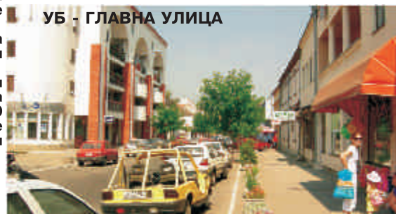
УБ - ГЛАВНА УЛИЦА

Основни циљ програма је повезивање људи, заједница и привреде пограничних региона две земље и њихових локалних самоуправа и заједничко учешће у активностима од општег инетерса.