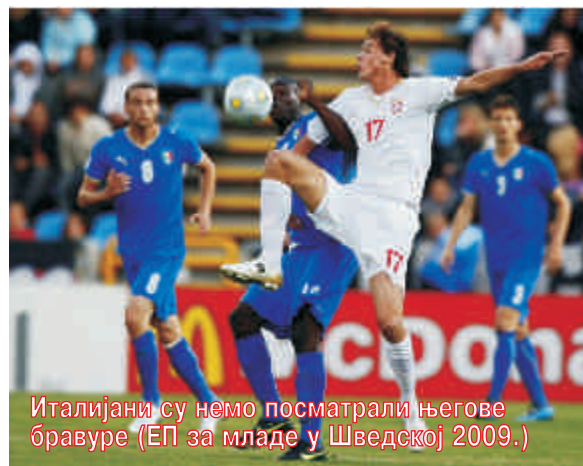
Италијани су немо посматрали његове бравуре (ЕП за младе у Шведској 2009.)

-Када вратим филм и сетим се да сам пре три и по године играо у Јединству и да сам у једном моменту чак и напустио фудбал, могу да кажем да нисам ни сањао. Било је ту свега. Избегавао сам тренинге, нисам имао вољу. Дешавало ми се да кренем на тренинг, а да то време преседим у парку чисто да ми прође време. Тада су Јединству биле важније друге ствари од фудбала. Никако