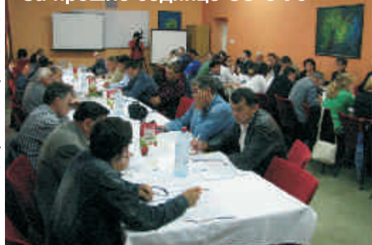
Са прошле седнице СО-е Уб

За ово заседање локалног парламента у Убу карактеристично је то што се на дневном реду нашло