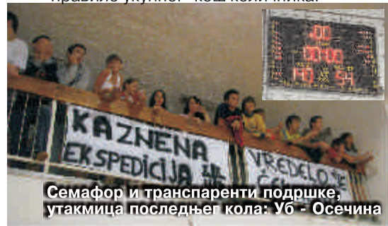
Семафор и транспаренти подршке, утакмица последњег кола: УБ - Осечина