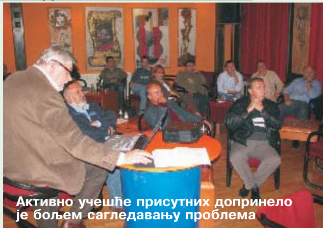
Активно учешће присутних допринело је бољем сагледавању проблема