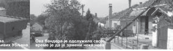
Улични билијар - нова дисциплина довитљивих Убљана Ова бандера је одслужила своје време је да је замени нека нова