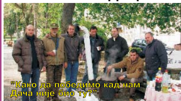
"Како да победимо кад нам Дача није био ту?"