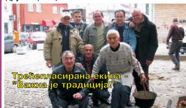
Трећепласирана екипа - "Важна је традиција!"