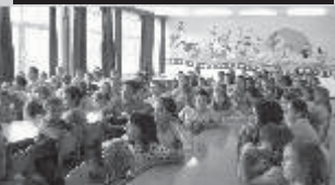
Убски основци са пажњом прате један од програма које је организовала Градска библиотека "Божидар Кнежевић"

Где смо ми ту? На почетку, али смо кренули. Израда ГИС-а, геодетског информационог система, као основе читавог информационог система, за двадесетак дана биће готови. Његова примена у пракси одрадиће се са колегама из Инђије. Не треба ништа измишљати. Треба преписати. Нова зграда општине се поставља као приоритет. Нема сервиса грађана и шалтера на другом спрату. Упоредо правити систем који не зависи од тога ко је на власти и ко се како зове. Е, онда није чудно да председник истоимене општине не уђе у зграду исте по две, три недеље, а да све функционише. Функција председника и јесте да решава дугорочне и стратешке проблеме, а не свакодневне. До тог циља треба стићи брзо.