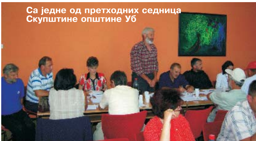
Са једне од претходних седница Скупштине општине УБ