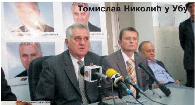
Томислав Николић у Убу

Српска напредна странка, која ће у новембру и у Убу одржати своју прву изборну скупштину Општинског одбора, одржала је конференцију за штампу на којој је говорио лично председник странке Томислав Николић. У непосредном разговору са новинарима Николић је истакао своје контакте, које је остварио у Америци, али и у Русији, као и решеност Српске напредне странке да стане на пут корупције и криминалу у Србији, а на питање репортера "Гласа Тамнаве" одговорио је да је готово сигурно заказивање ванредних парламентарних избора већ на самом почетку пролећа. Николића је, иначе, дочекао (и испратио) велики број присталица СНС-а у Убу.