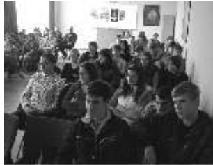
Где смо ми ту?

Одлуком Владе Србије, октобра 2009. године је проглашен месецом борбе против трговине људима. Тим поводом, гости убске средње школе су били представници Полицијске управе Ваљево. Они су за старије школаре припремили занимљиво предавање, чији је циљ скретање пажње на светски проблем трговине људима и на могућност да свако од нас може бити жртва ове негативне појаве.