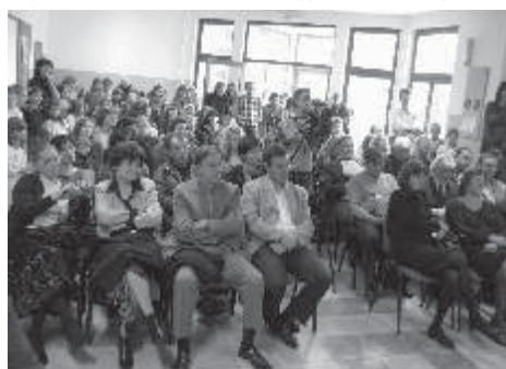
Врши обуку запослених за безбедан рад

—Наша школа тренутно броји 253 ученика распоређених у седамнаест одељења. За разлику од осталих школа са свеоког подручја, ми ове године нисмо имали проблем затварања одељења. Шта више, у односу на прошлу годину, имамо осам ученика више. Школа у Радљеву из године у годину поприма модернији изглед, о чему директорка са поносом прича: —Пре четири године смо донели школски развојни програм. У међувремену, саградили смо нову школску зграду и адаптирали стару, а у издвојеним одељењима у Бргулама и Шаробанама увели топлу воду и урадили морке чворове. Једини недостатак са којим се суочавамо је непостојање сале за физичко васпитање, али се надам да ћемо у годинама које долазе бити у могућности да овакве приредбе одржавамо и у једном таквом објекту.