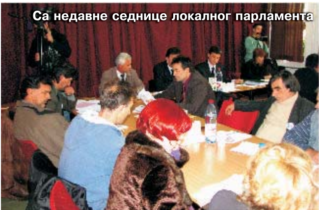
Са недавне седнице локалног парламента

Седница локалног парламента, иако је обилувала оштрим опаскама и, на моменте, жучним дискусијама завршена је на задовољство позиције јер је усвојено све што је предложено а, како рече један одборник, на изласку из сале Средње школе, где је седница одржана, добро је да постоји и сукоб мишљења. Не би ни било нормално да се увек сви слажу.