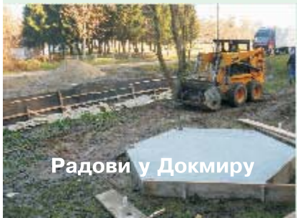
Радови у Докмиру

Топли новембарски дани омогућили су привођење крају јавних радова на уређењу изворишта који се налазе у близини школа у Докмиру и Врелу. Околина старе чесме у Докмиру полако поприма нов изглед, а читав пројекат подразумева санацију чесме и одводних канала, као и формирање мањег језера у сврху лакше експлоатације. Мештани овог села већ годинама користе овај извор за снабдевање водом, а ускоро ће им још доступнији. Након тога, машине ће се преселити у Врело, где ће се радили на механичком чишћењу канала и санацији околине извора у Рашћу.