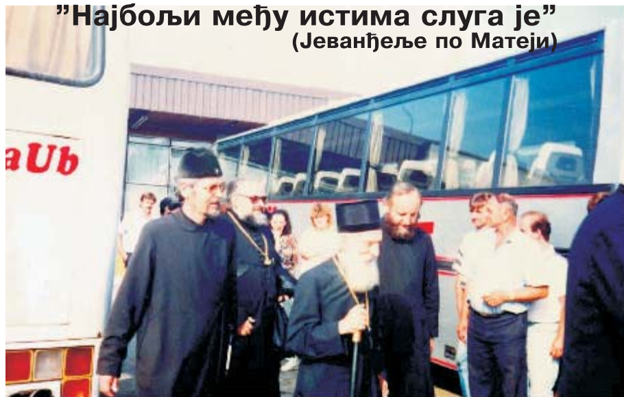
Убски свештеници у пратњи патријарха Павла - на Убу

"Најбољи међу истима слуга је" (Јеванђеље по Матеји)