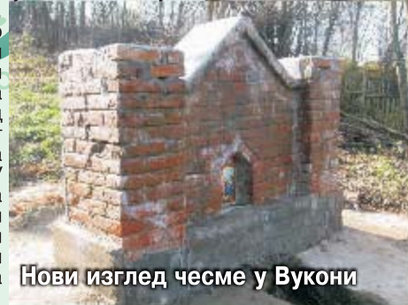
Нови изглед чесме у Вукони