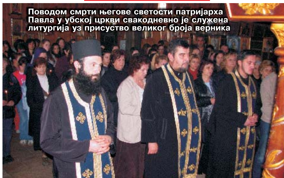
Поводом смрти његове светости патријарха Павла у убској цркви свакодневно је служена литургија уз присуство великог броја верника