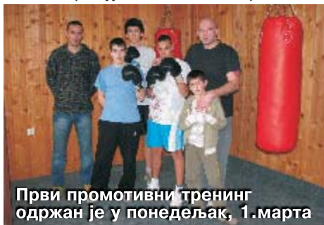
Први промотивни тренинг одржан је у понедељак, 1.марта