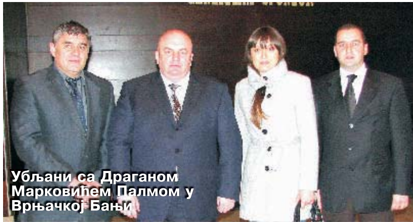
Убљани са Драганом Марковићем Палмом у Врњачкој Бањи