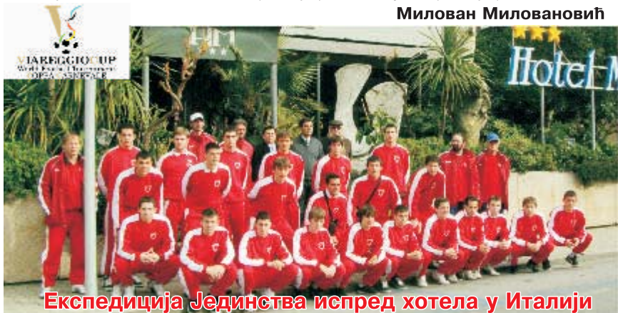
Експедиција Јединства испред хотела у Италији

Распоред утакмица Јединства у марту у Српској Лиги Запад: