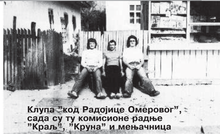
Клупа “код Радојице Омеровог”, сада су ту комисионе радње “Краљ”, “Круна” и мењачница