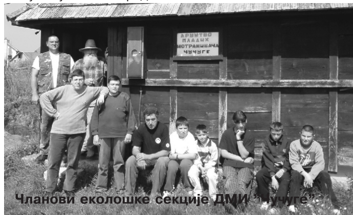
Чланови еколошке секције ДМИ "Чучуге"

Поред ПЕТ амбалаже прикупљане су и остале врсте смећа. Том приликом сакупљено је око 20 врећа отпада, а радује податак о мањој количини ђубрета у односу на претходне године у овом периоду. У оквиру акције, поред осталог, грађанима је подељена одређена количина пропагандних летака о очувању животне средине.