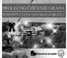
PROLEĆNO ČIŠĆENJE GRADA. POMOZITE I VI DA NAŠ GRAD ZABLISTA.

Традиционална акција „Очистио град“ Комуналног јавног предузећа „Ђунис“ започела је 10. априла. Прикупљање кабастог смеђа уринује се до 22. маја, по утврђеном распореду. Да би се посао лакше и ефикасније обавио, градско насеље подељено је на шест реона, из којих ће се смеђе одвозити суботом.