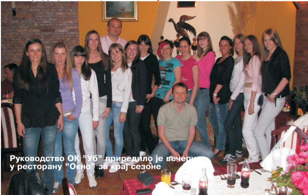
Руководство ОК "УБ" приредило је вечеру у ресторану "Окно" за крај сезоне