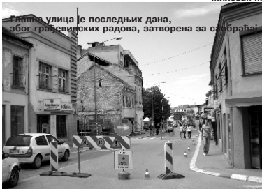
Главна улица је последњих дана, због грађевинских радова, затворена за саобраћај

Није тајна да постоји предлог да се главна улица поново затвори за саобраћај чиме би, заједно са парком, чинила градски трг. О томе ће се, свакоко, водити велике полемике. Као провера како би то изгледало може да нам послужи искуство од последњих неколико дана када је главна улица, због грађевинских радова, била затворена. Милован М