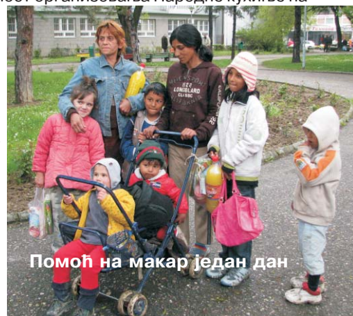
Помоћ на макар један дан

Поред општинске управе и директорке Гимназије, акцију је подржала неколицина убских предузећа и предузетника у виду донирања прехранбеним производима: СТАР "Кића", "Тамнава", "Питас Хаус", "Форнети", Пекара "Срба", Пекара "Гаврић", Пекара "Тифани", Грил "Милосав".