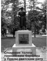
Споменик палим тамнавским борцима у Првом светском рату

Као увод у комплетну реконструкцију убског Градског парка, средином априла, извршена је ресторација споменика палим тамнавским борцима у Првом светском рату. Као пројектант у овом послу учествовао је ваљевски Завод за заштиту споменика, док су средства у висини од 1.200.000 динара обезбеђена из буџета Републике Србије.