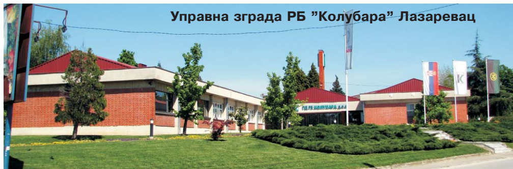
Управна зграда РБ "Колубара" Лазаревац