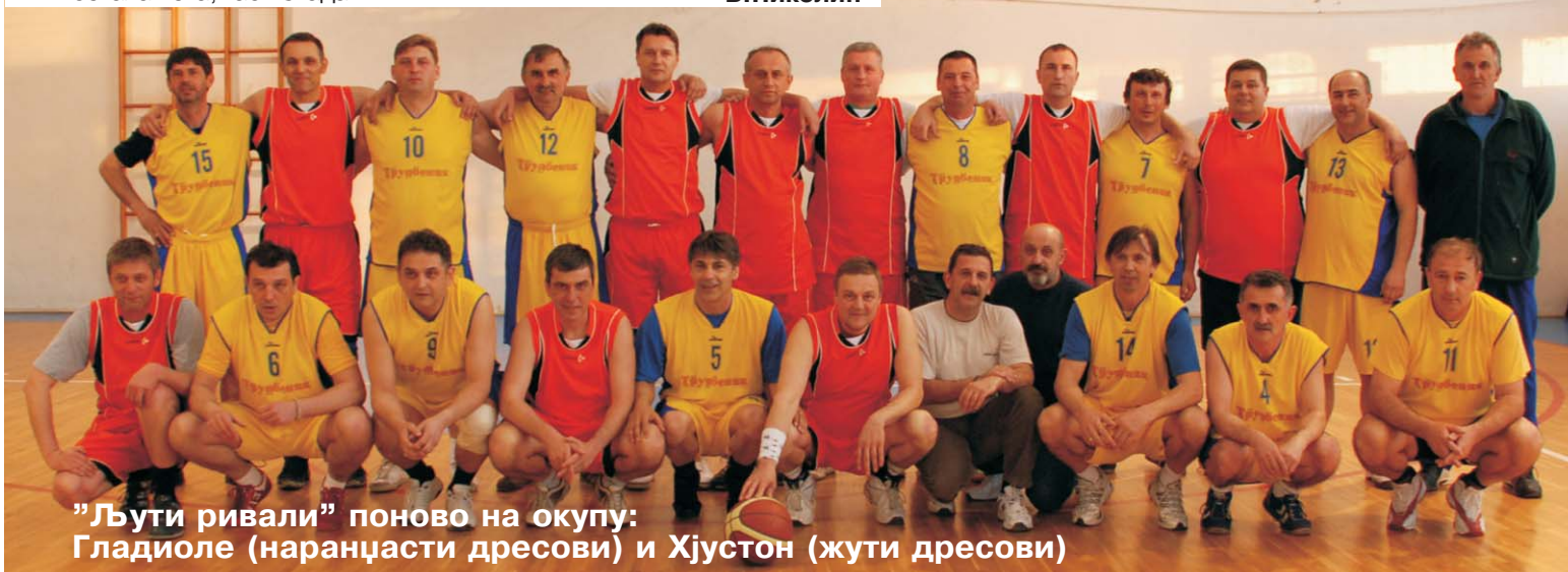
"Љути ривали" поново на окупу: Гладиоле (наранџасти дресови) и Хјустон (жути дресови)