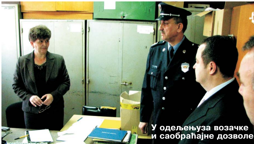
У одељењу за возачке и саобраћајне дозволе