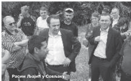
Расим Љајић у Совљаку

Реке Тамнава и Уб, са својим мањим притокама, поплавиле су око 4000 хектара. Тамнава је поплавила око 300, а Убача око 100 домаћинстава. Насипи на реци Уб, на подручју градског насеља, просечени су на четири места како би било спречено неконтролисано преливање воде. Убску општину посетио је 24. јуна и министар Расим Љајић, који је са представницима Одељења за ванредне ситуације из Колубарског округа и убске општине, обишао угрожена подручја, разговарао са грађанима и обећао помоћ државе.