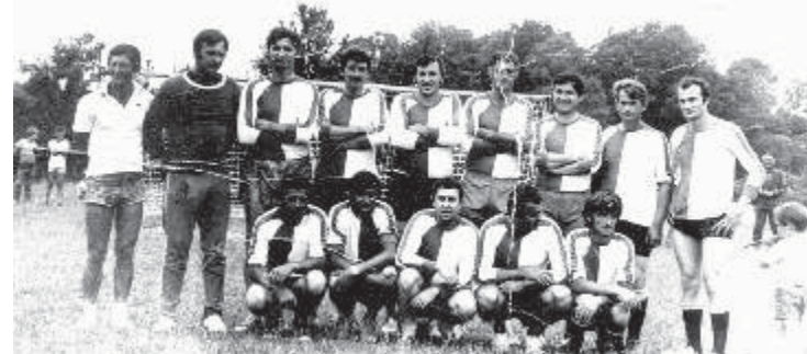
Ѓуњевац, 1.јули 1979.г, после утакмице ветерани-млади тим (4:4). На слици: