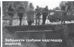
Забринуте грађани надгледају водостај