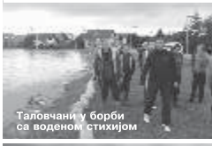
Таловчани у борби са воденом стихијом