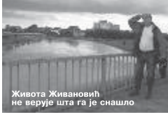
Живота Живановић не верује шта га је снашло