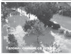
Талови - снимак са ваздуха