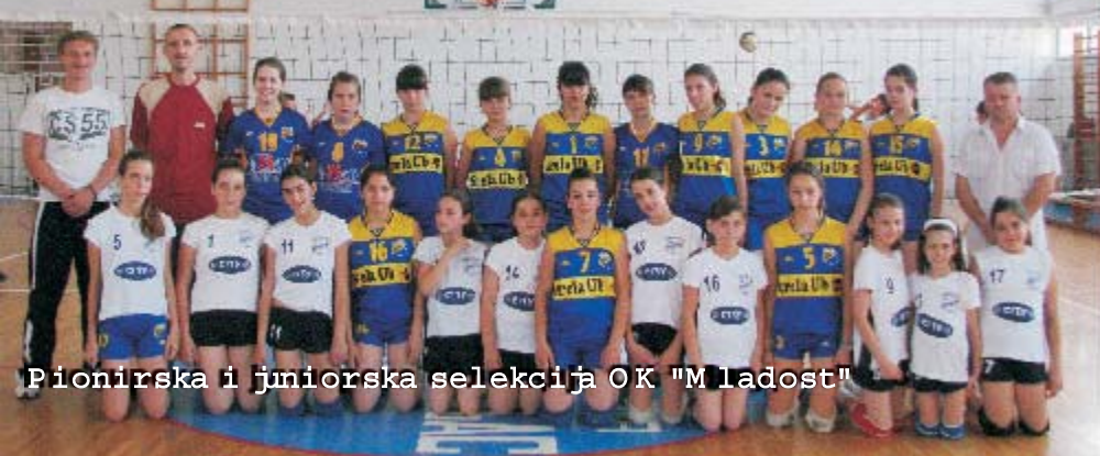
Pionirska i juniorska selekcija ОК "Mladost"