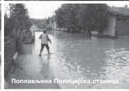
Поплављена Полицијска станица