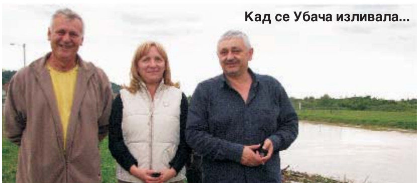
Кад се Убача изливала...