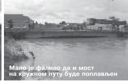
Мало је фалило да и мост на кружном путу буде поплављен