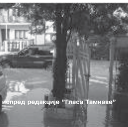
Призор испред редакције "Глас Тамнаве"