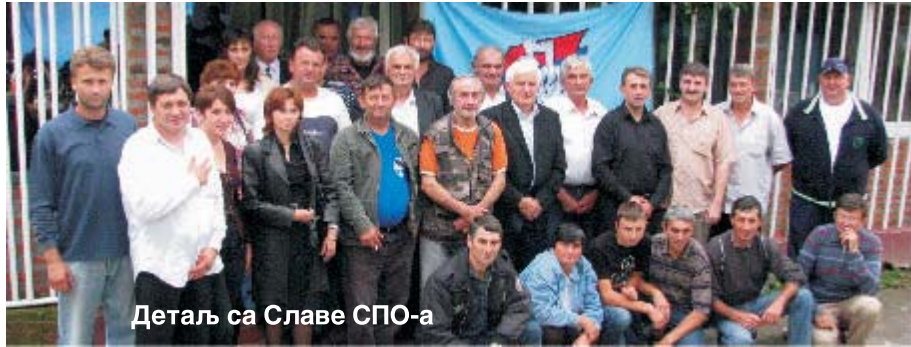
Детаљ са Славе СПО-а