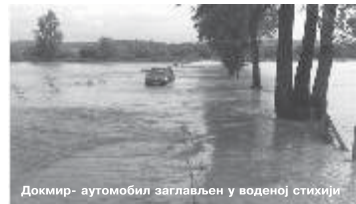
Докмир - аутомобил заглављен у воденој стихији