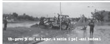
Ub - prvo g do { ao bager, a zatim i pe { -ani bedemi