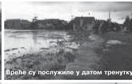
Вреће су послужиле у датом тренутку