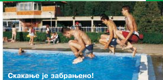
Скакање је забрањено!

Цене једносатног коришћења терена на СРЦ "Школарец": МИНИ-ПИЧ ФУДБАЛСКИ ТЕРЕН дневни и ноћни термин (од 10 до 23 ч)..... 1.000 дин. ТЕНИСКИ ТЕРЕНИ дневни термин (од 10 до 19 ч).....400 дин. ноћни термин (од 19 до 23 ч).....600 дин.