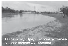
Талови - код Предшколске установе је прво почело да прелива