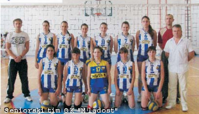
Seniorski tim ОК "Mladost"