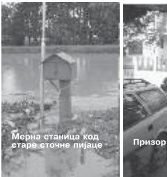
Мерна станица код старе сточне пијаце