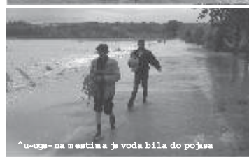
^u-uge - na mestima g voda bila do pojsaa