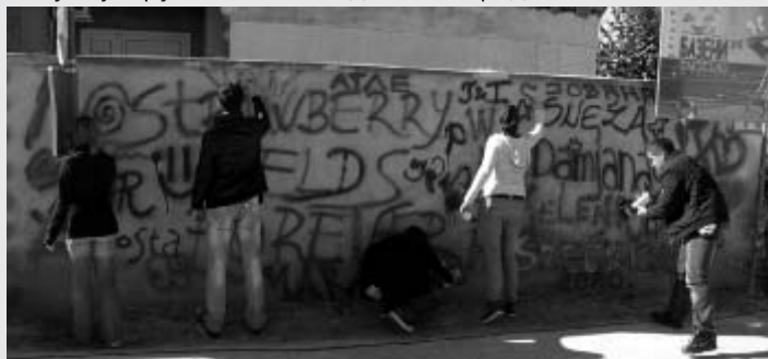
Још један зид који је намењен за писање

Друга акција у оквиру ове кампање организована је на иницијативу убских гимназијалаца, који су, у петак 22.октобра, на зиду код Градских база, наставили реализацију пројекта "Зиграф". Ова акција посвећена је заштити људске имовине од непримереног шарања по зидовима града. Након "цртања" импровизованог зида код Поште, којим је зачет овај својврстан протест пре неколико месеци, још једна локација на Убу ће служити младима да се слободно изражавају у популарном писању по зиду. Онима који размишљају да то чине на другим местима, гимназијалци поручу да ће на Убу ускоро бити постављен видео-надзор који ће испратити сваки покушај нарушавања изгледа нашег града.