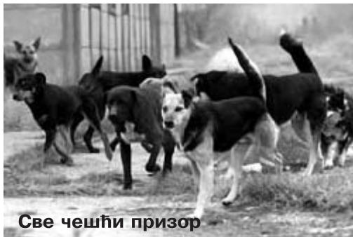
Све чешћи приказ

у текућој години исплатила 1.200.000 динара, што није коначна цифра, јер је још неколико оваквих случајева још у судском поступку. За изградњу азила за псе из општинског буџета је одређено пет милиона динара, па је јасно да ће општина овим поступком уштедети на дугорочном нивоу, а још важније, заштитити своје суграђане од напада бесних паса.