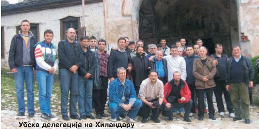
Убска делегација на Хиландару