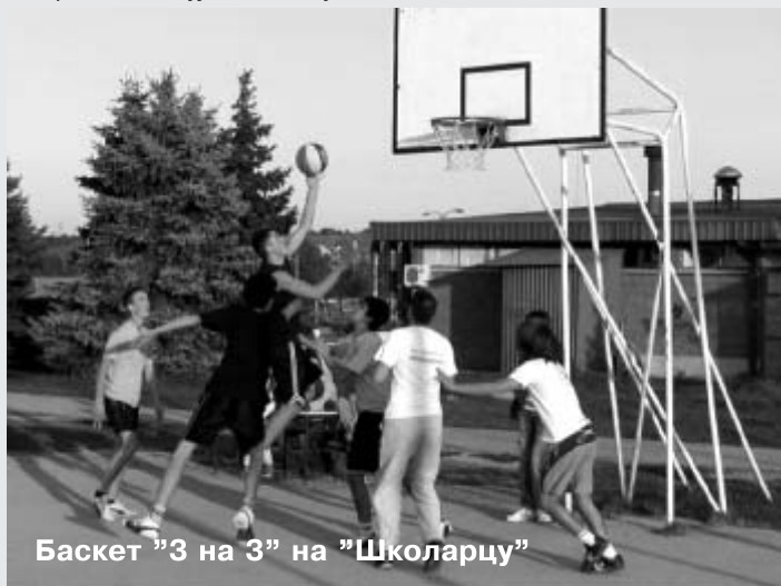
Баскет "3 на 3" на "Школарацу"

Најпре је 7.октобра приређен "Јавни догађај" на СРЦ "Школарац" и у Дому културе, који је подразумевао окупљање и дружење убске омладине. Манифестација се састојала из спортског дела, у коме су одржана такмичења у баскету "3 на 3" и фудбалу на мини-пич терену, и културног, где су у сали Дома културе заједнички концерт приредили КУД "Тамнава" и Балетски студио "Атена". Након целокупног програма, за учеснике акције је приређен коктел-журка, а за добру атмосферу је био задужен ДЈ Меда. Ова манифестација је добила највише оцене од представника Министарства и НВО "Здраво да сте", а општина УБ је једина у региону која се одазвала позиву за организацију ове акције.