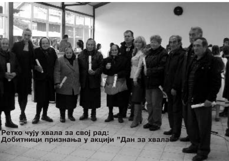
Ретко чују хвала за свој рад: Добитници признања у акцији "Дан за хвала"