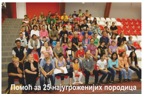
Помоћ за 25 најугроженијих породица

- Од донатора са разних страна, укључујући ту и појединце који су донирали путем броја 1103, на посебном рачуну Владе имамо око 20 милиона евра. Укупна сума ће бити вишеструко већа, међутим до те помоћи води утврђени процес који се одвија по одређеним прописаним стандардима. Начин на који смо помоћ из Емирата добили је врло јасан знак да ту помоћ добијамо од срца - рекао је Благојевић.