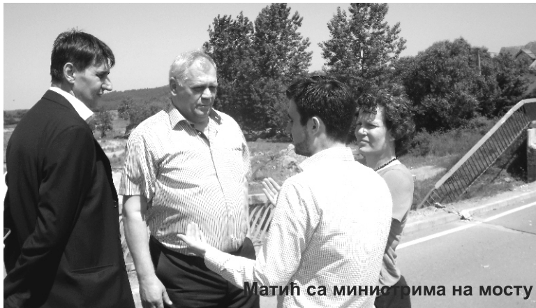
Матић са министрима на мосту

Локална је самоуправа саопштила да је прелиминарна штета од поплава око 350 милиона динара.