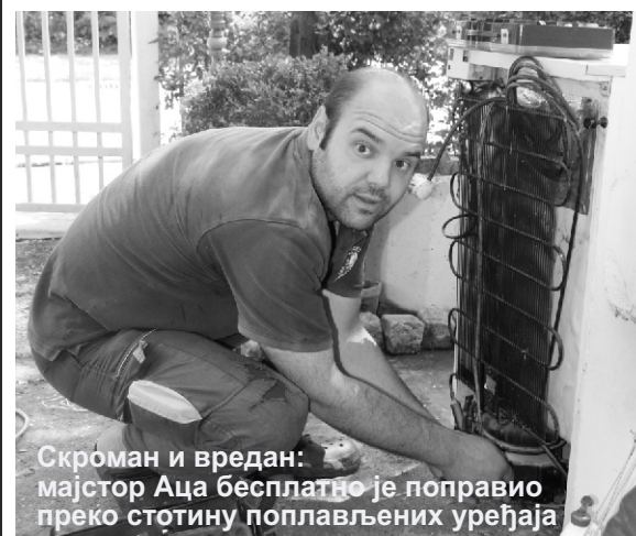
Скроман и вредан: мајстор Аца бесплатно је поправио преко стотину поплавлених уређаја

Од грађана сам примао само онолико новца колико су коштали делови за поправку поплавлених уређаја. Моје услуге и одлазак на терен нисам рачунао. Једноставно, осетио сам потребу да се нађем људима у невољи- рекао нам је овај скромни момак и врсни електричар.