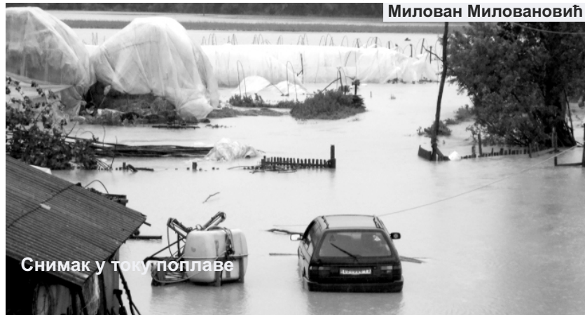
Снимак у току поплаве