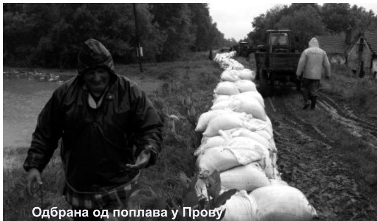
Одбрана од поплава у Прову

У складу са Статутом општине Владимирци и Упутством о јединственој методологији за процену штета од елементарних непогода, на основу којих је и образована Комисија, молимо све становнике са подручја општине Владимирци, а који су погођени елементарном непогодом, да дођу до просторија општине како би, уредно попуњен захтев, предали Комисији, која ће даље поступање по истом спроводити одласком на поплављено подручје и после увиђаја сачинити записник.