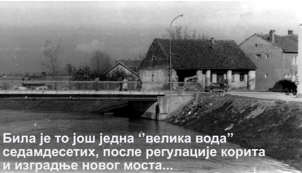
Била је то још једна "велика вода" седамдесетих, после регулације корита и изградње новог моста...