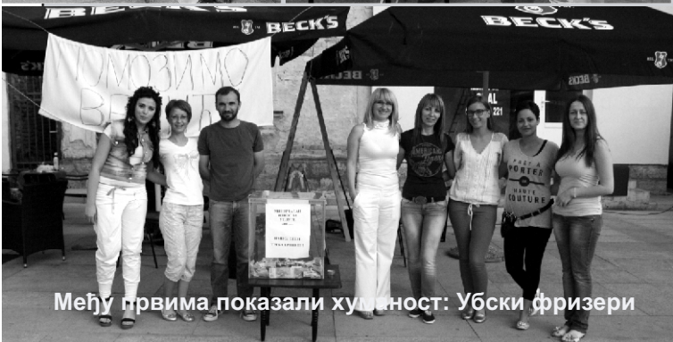
Међу првима показали хуманост: Убски фризери