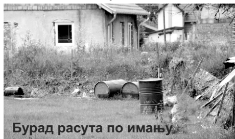
Бурад расута по имању

- На мом имању завршила су бурад очигледно веома штетног садржаја. Црна течност расула се по имању и ја сад не знам шта да радим. Ту бурад ми је донела вода са једног од оближњих плацева и, отприлике, ми је познато њихово порекло. Међутим, и поред многобројних позива, комунална инспекција посетила ме је само једном, пре две недеље, и од тада од њих нема ни трага, ни гласа. Са