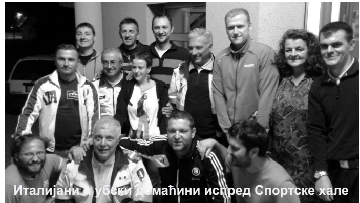
Италијани, убски домаћини испред Спортске хале

Осим Убљана, уз одређену потврду, пакете помоћи добијали су и Обреновчани. Наша општина је пружила помоћ за 1.201 становника Обреновца. Д.К.