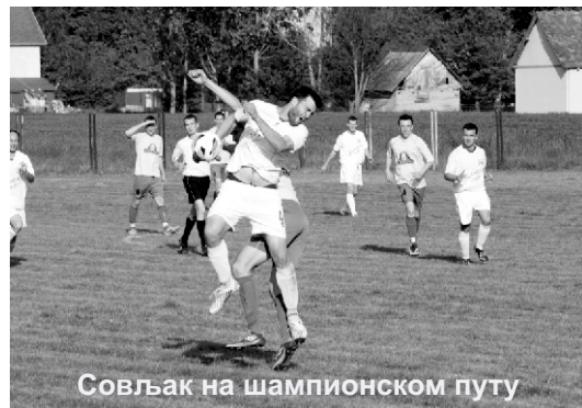
Совљак на шампионском путу