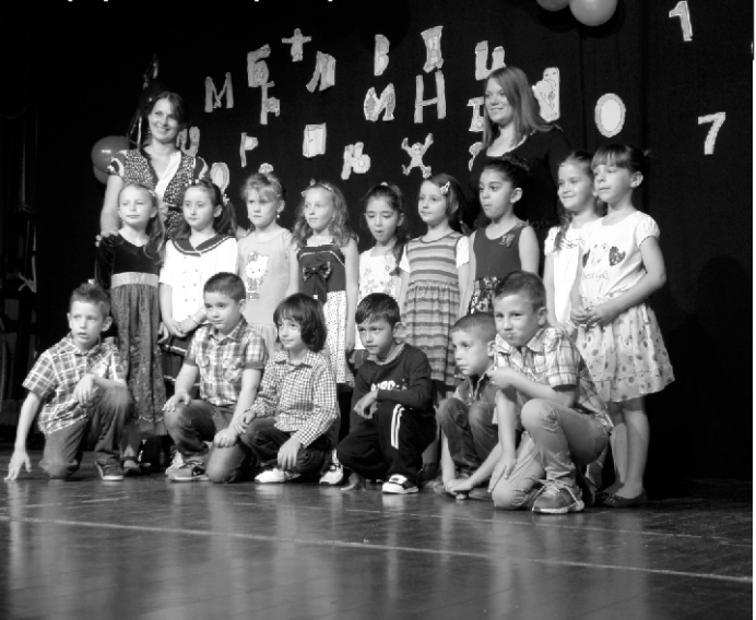
Приредба за пример