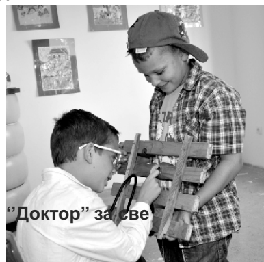
“Доктор” за све