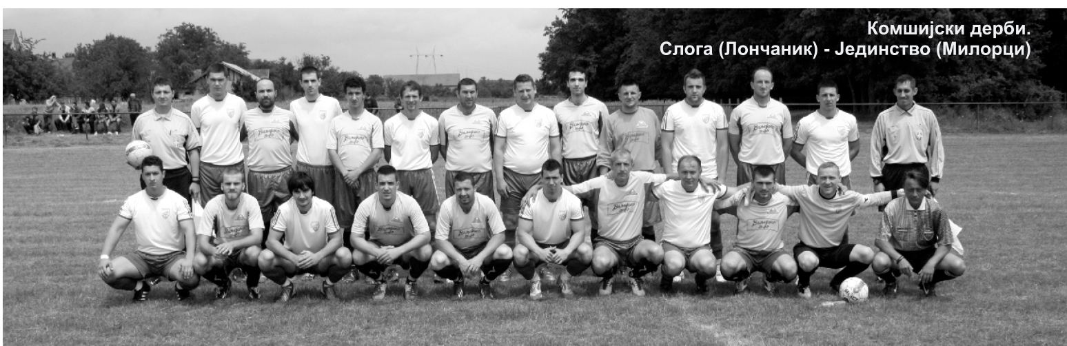
Комшијски дерби. Слога (Лончаник) - Јединство (Милорци)

ФИНАЛЕ: среда 18. јун и недеља 22. јун-17 часова