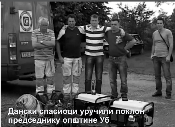
Дански спасиоци уручили поклон председнику општине Уб