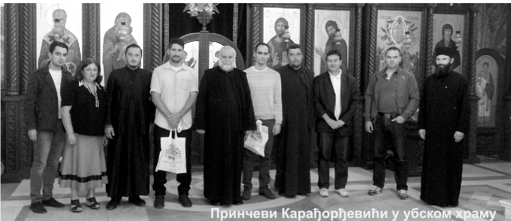
Принчеви Карађорђевићи у убском храму

Принчеви Карађорђевићи, Александар (син престолонаследника Александра II) и Михаило (син принца Томислава), поводом хуманитарне мисије помагања угроженом становништву у Србији, након катастрофалних поплава, посетили су Храм Христа Спаситеља у Недељу Светих Отаца, 1. јуна.