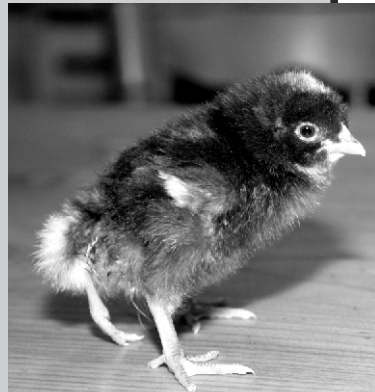
Природа се поиграла: Пиле звано Тихи

У домаћинству Андрића из Јошеве живи пиле са четири ноге. Име му је Тихи и представља атракцију, како за укућане, тако и за цео комшилук. Слободно трчкара по дворишту и нимало не заостаје за осталим пилићима. Како кажу његови власници, у почетку нису приметили никакве необичности, квочка је излегла пилиће као и много пута до сада.