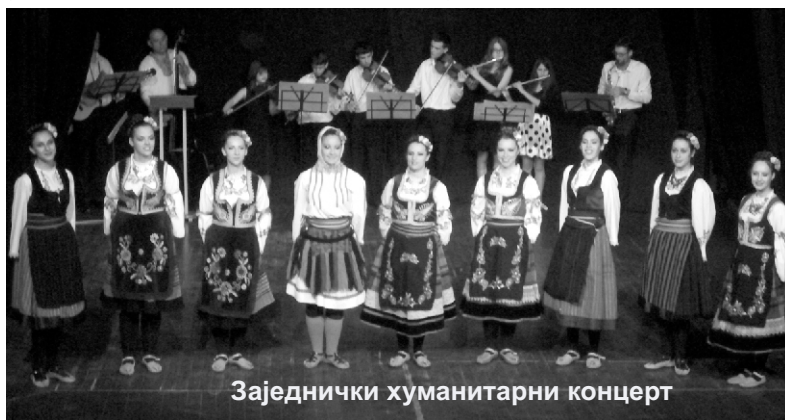
Заједнички хуманитарни концерт

Удруженим снагама, КУД „Тамнава“ и Градски оркестар „Уб“ одржали су хуманитарни концерт 31. маја, у сали Дома културе. Циљ концерта био је био прикупљање средстава за санирање штете поплављене Предшколске установе Уб. На овај позив одазвало се око 120 посетилаца. Иако је цена улазнице била 200 динара, већина их је дала и много више.