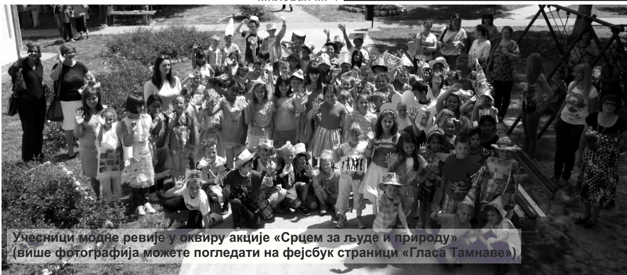
Учесници модне ревије у оквиру акције «Срцем за људе и природу» (више фотографија можете погледати на фејсбук страници «Гласа Тамнаве»)

Током ова два дана у холу школе налазила се и поставка ученичких радова на тему заштите животне средине, а сва прикупљена средства од изложбе и фудбалског турнира су преусмерена у хуманитарни фонд. Милован М.