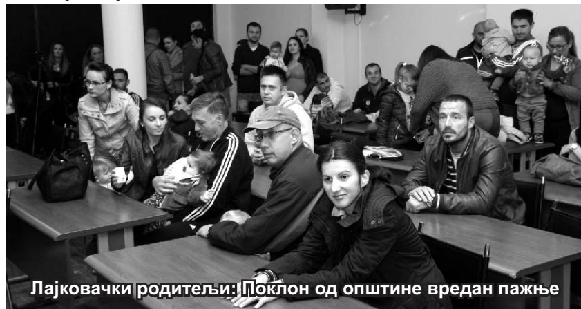
Лајковачки родитељи: Поклон од општине вредан пажње