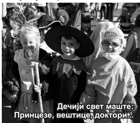
Дечији свет маште: Принцезе, вештице, доктори!..

Упркос најавима о лошим временским условима праћеним кишом, малишане је у уторак, 4. октобра, дочекао сунчан и ведар дан, па су са радошћу на маскембалу показали своју и креативност родитиља, а учешће су узеле и јаслене групе, које су изашле испред вртића, заједно са малишанима из млађих група. Остале групе, у шареним костимима, са добро осмишљеним маскама, прошетале су главним улицама града, предвођене припадницима саобраћајне полиције, који су обезбеђивали несметано кретање колоне.