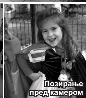
Позирање пред камером