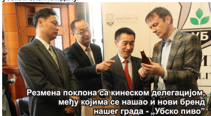
Размена поклона са кинеском делегацијом, међу којима се нашао и нови бренд нашег града - „Убско пиво“

Висока делегација пријатељског града Хуаинан, из кинеске покрајине Анхуеј, посетила је општину Уб у недељу, 10. октобра. Том приликом, са представницима наше локалне самоуправе, одржан је састанак о потенцијалној сарадњи из различитих области, међу којима се посебно истиче култура, која је започета прошлогодишњим наступом кинеског плесног ансамбла на убском Златном дану.