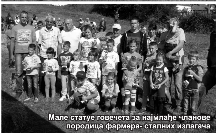
Мале статуе говечета за најмлађе чланове породица фармера- сталних излагача