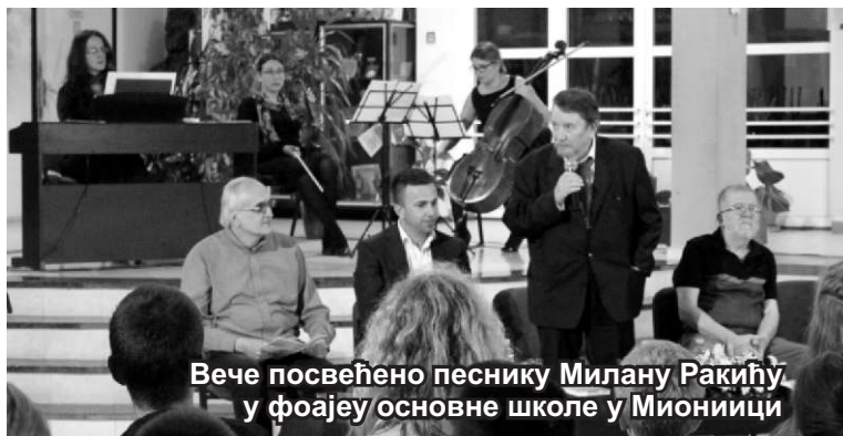
Вече посвећено песнику Милану Ракићу у фоајеу основне школе у Мионици

- Милан Ракић је, уз Јована Дучића, Симу Пандуровића и друге, био утемељитељ српске модерне поезије. Он је предводник струјања која су српску поезију од традиционалног преокренула ка модерном духу. Иако му дело по обиму није велико, по ономе што је написао је изузетно значајно-рекао је Андрић.