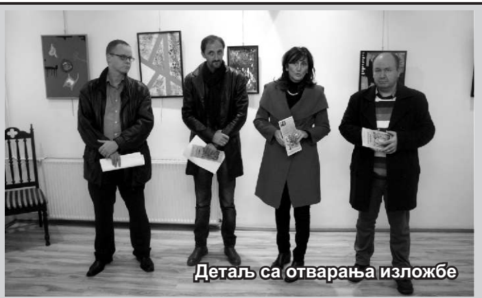
Детаљ са отварања изложбе