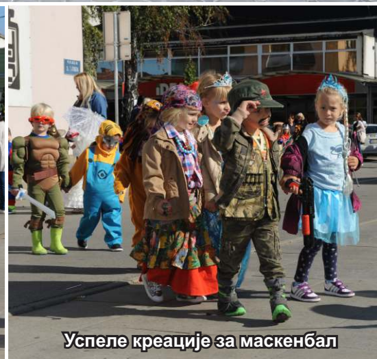
Успеле креације за маскенбал