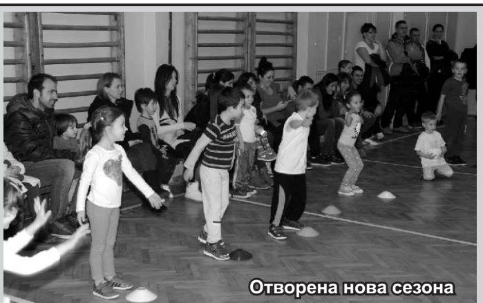
Отворена нова сезона

Први тренинг је био бесплатан, а заинтересовани родитељи могу и даље поменути данима уписивати своју децу у „Малце Тамнавце“ и обезбедити свом детету квалитетну физичку активност кроз занимљиве игре и дружења. Школицу већ похађа 30 деце. Иако мали, „Малци Тамнавци“ се врло брзо адаптирају на игре и тренинге и успешно савладавају сваки постављени задатак.