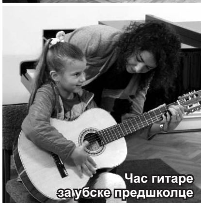
Час гитаре заубске предшколце

Дечја недеља, која се на нашим просторима обележава од 1934. године, Законом о друштвеној бризи о деци, уведена је 1987. године, на иницијативу организације Пријатељи деце Србије. Д.К.