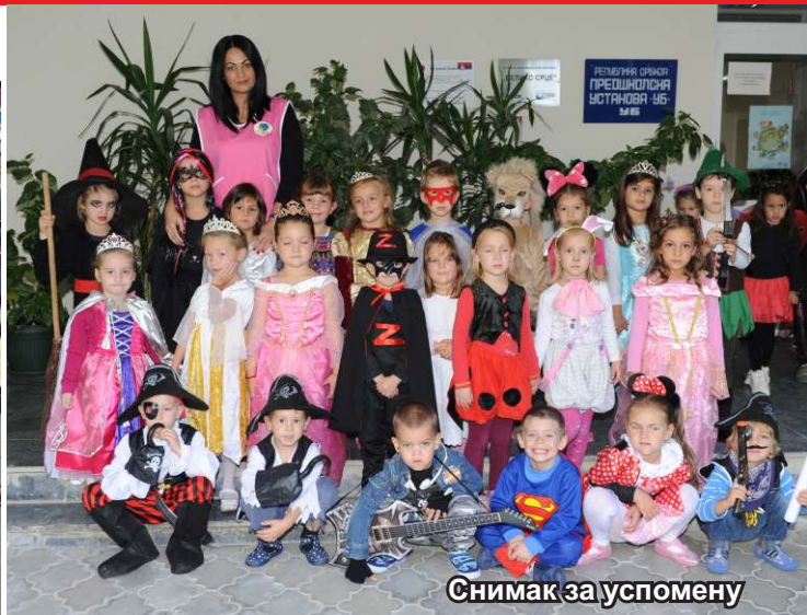
Снимак за успомену