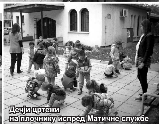
Дечји цртежи на плочнику испред Матичне службе