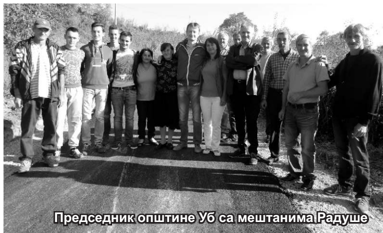
Председник општине Уб са мештанима Радуше