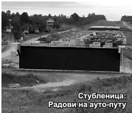
Стубленица: Радови на ауто-путу

За време извођења радова, биће дозвољено да зони радова приђу само интервентна возила и мештани који живе у зони радова. У случају да дође до неких других измена, грађани ће бити благовремено обавештени.