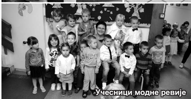
Учесници модне ревије