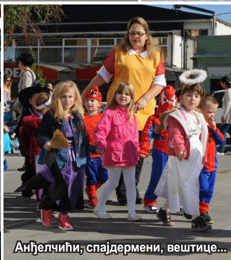
Анђелчићи, спајдермени, вештице...