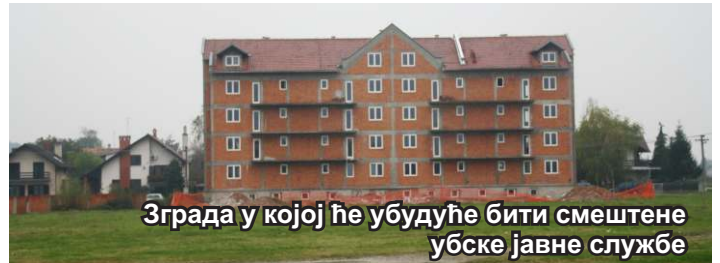
Зграда у којој ће убудуће бити смештене убске јавне службе

- Надам се да ћемо ускоро моћи да забележимо и привођење крају радова на објекту зграде солидарне стамбене изградње, где је при крају прва фаза радова, то јест стављање столарије и уређење објекта изнутра. Надам се, такође, да би, већ наредне године, могли све јавне службе ту да