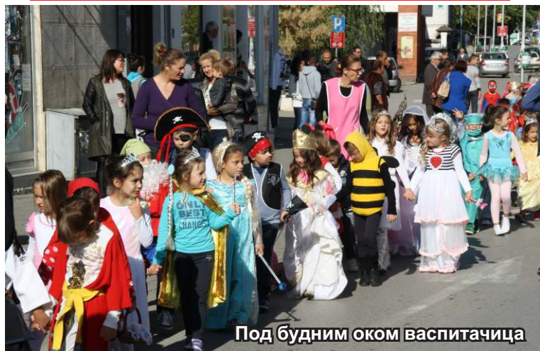
Под будним оком васпитачица