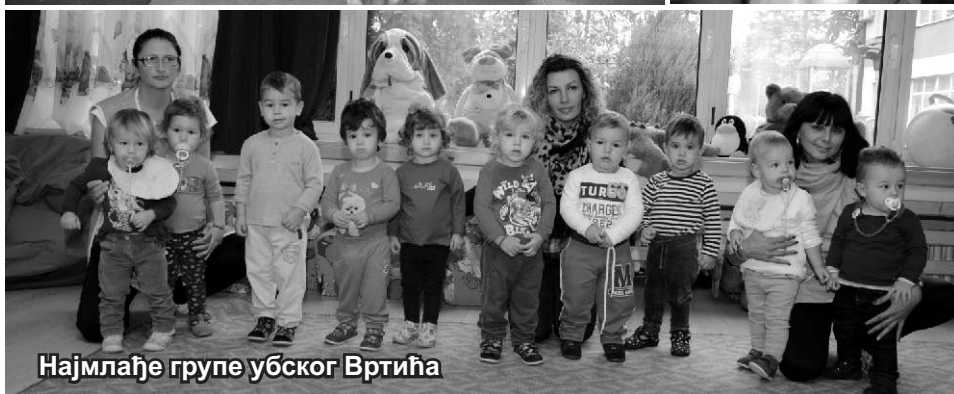
Најмлађе групе убског Вртића