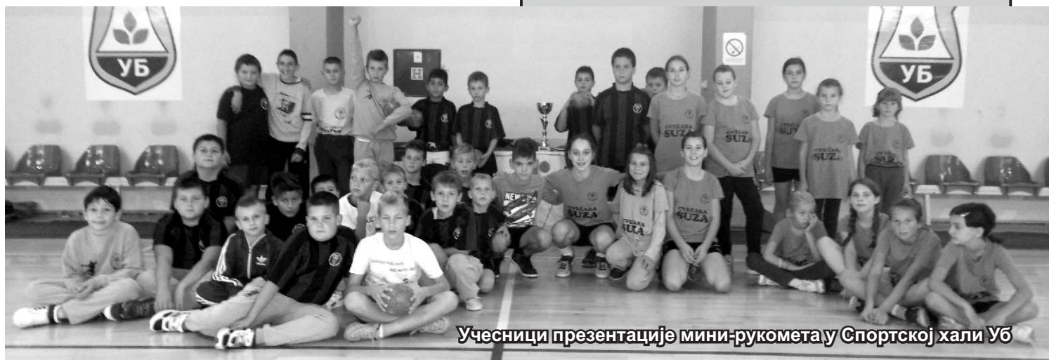
Учесници презентације мини-рукомета у Спортској хали Уб