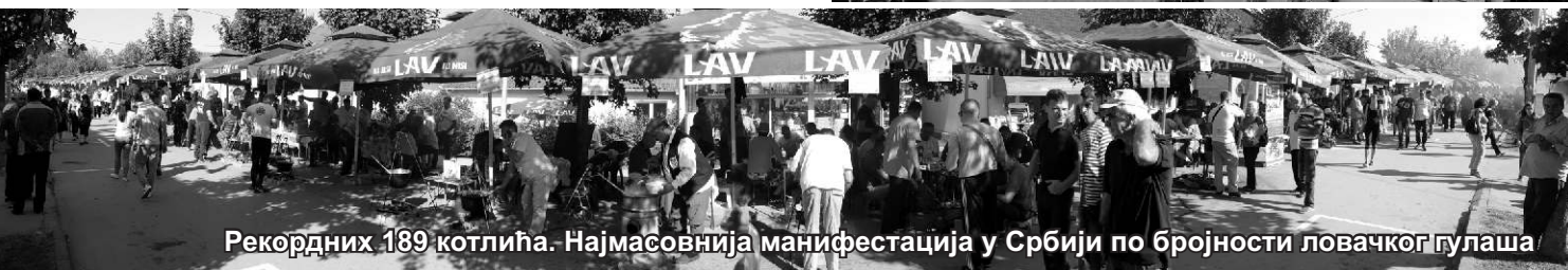
Рекордних 189 котлића. Најмасовнија манифестација у Србији по бројности ловачког гулаша