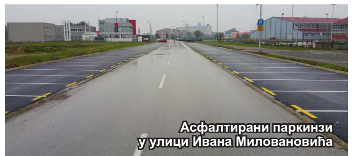
Асфалтирани паркинзи у улици Ивана Миловановића

- Инвеститора за поменути објекат смо већ обезбедили и са њим смо обавили неколико састанака, што је потврдило његову вољу и чврсту решеност да на том месту изгради хотел. Нама, сада, преостаје да одрадимо административни део посла и планом генералне регулације то омогућимо, а радови би требало да крену у рано пролеће. Паралелно са тим, трудићемо се да попунимо и остатак тог простора, одговарајућим парком који би био у централном делу, како би квалитетно уредили тај део града, улепшали га и дали му на значају. То је још једна од битнијих ствари које смо планирали и обећали, а искрено се надамо да ћемо је завршити током наредне године.