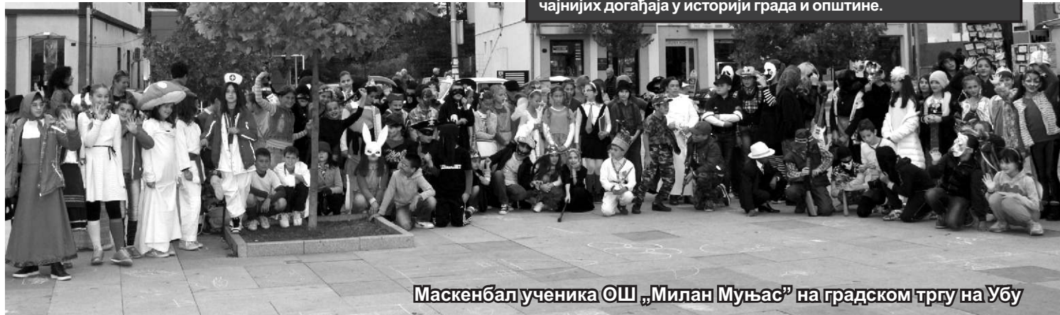
Маскенбал ученика ОШ „Милан Муњас“ на градском тргу на Убу

Ученицима првог и трећег разреда у преподневној смени, а другог и четвртог у поподневној смени, општина Уб поклонила је представу „Маша и медвед“, коју су извели у среду, 5. октобра, у холу школе, апсолвенти Факултета драмских