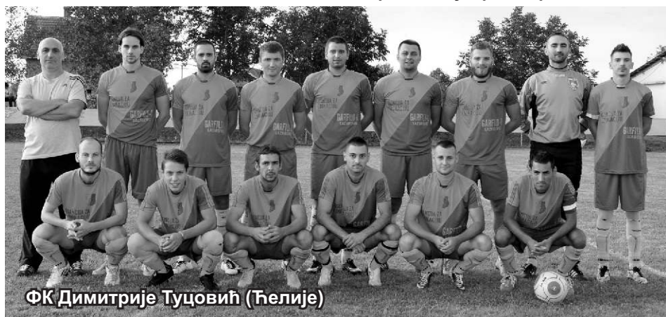
ФК Димитрије Туцовић (Ћелије)

„Глас ТАМНАВЕ“ МАРКЕТИНГ И ОГЛАСИ 064/2180-588