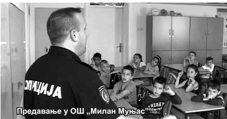
Предавање у ОШ „Милан Муњас“

Током Дечје недеље, у ОШ „Милан Муњас“ првацима су подељени едукативни приручници „Пажљивкова правила у саобраћају“, обезбеђена за већину ђака првака у Србији, а које је за њих припремила Агенција за безбедност саобраћаја Републике Србије.