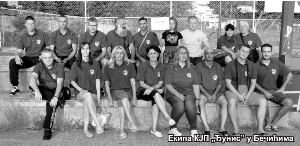
Екипа КЈП „Ђунис“ у Бечићима