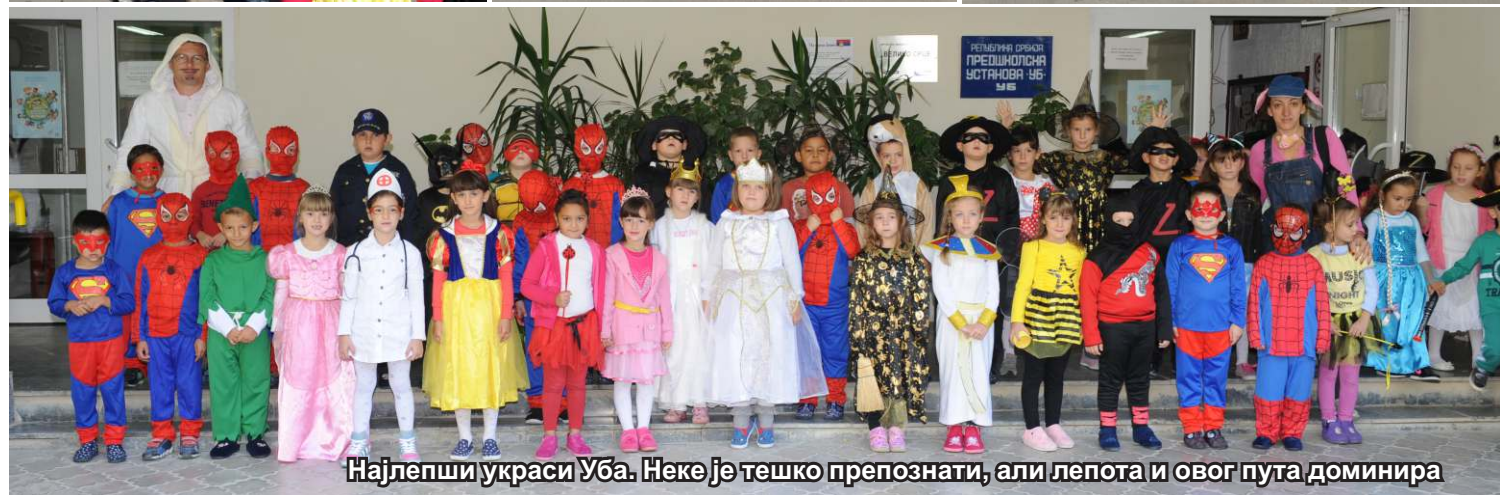
Најлепши украси Уба. Неке је тешко препознати, али лепота и овог пута доминира