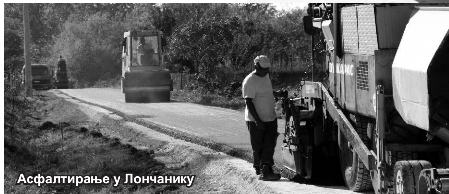
Асфалтирање у Лончанику

његовим речима, у наредном периоду ће се интензивно радити на решавању проблема прилазних путева до гробља у свим тамнавским селима.