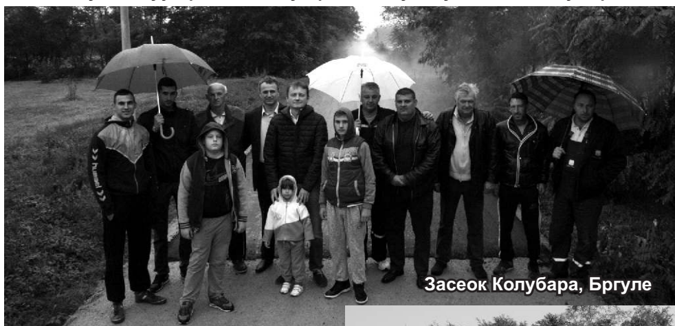
Засеок Колубара, Бргуле