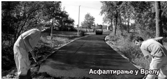
Асфалтирање у Врелу

„Не кажем да треба све асфалтирати, али барем десетак километара за које имамо спремне пројекте и покушаћемо да за њих дођемо до средства где год будемо могли да конкуришемо. Овде су углавном макадамски путеви, који су далеко скупљи за одржавање, пошто се сваке године морају пресипати, док је асфалт трајније решење. Поред путне инфраструктуре, треба још да се ради и реконструкција нисконапонске мреже, као и канализација кроз центар села,