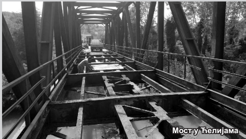
Мост у Ћелијама