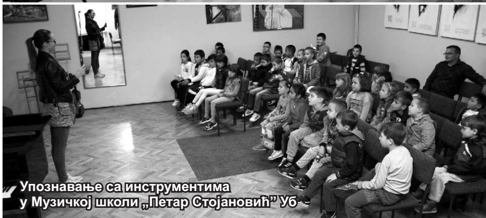
Упознавање са инструментима у Музичкој школи „Петар Стојановић” Уб