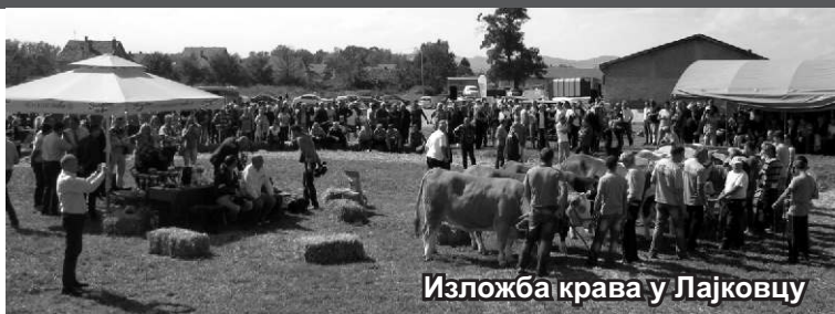
Изложба крава у Лајковцу