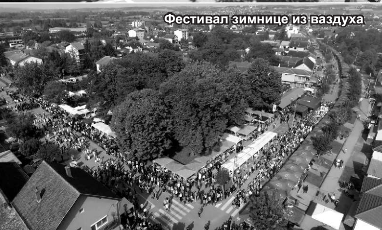
Фестивал зимнице из ваздуха

Да је Република Србија схватила значај овог Фестивала а и развоја села, сведоче и речи министра пољопривреде Бранислава Недимовића, који је отворио Фестивал: „Желим да чујем шта је то што мучи произвођаче. Један од мојих задатака у наредне две-три године биће, да вратимо један прерађивачки центар у Коцељеву, а изаћи ће и пакет мера за повољну набавку механизације“.