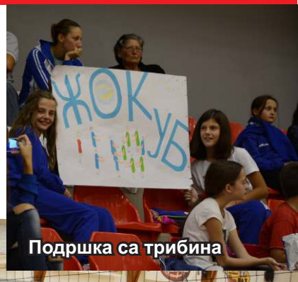
Подршка са трибина