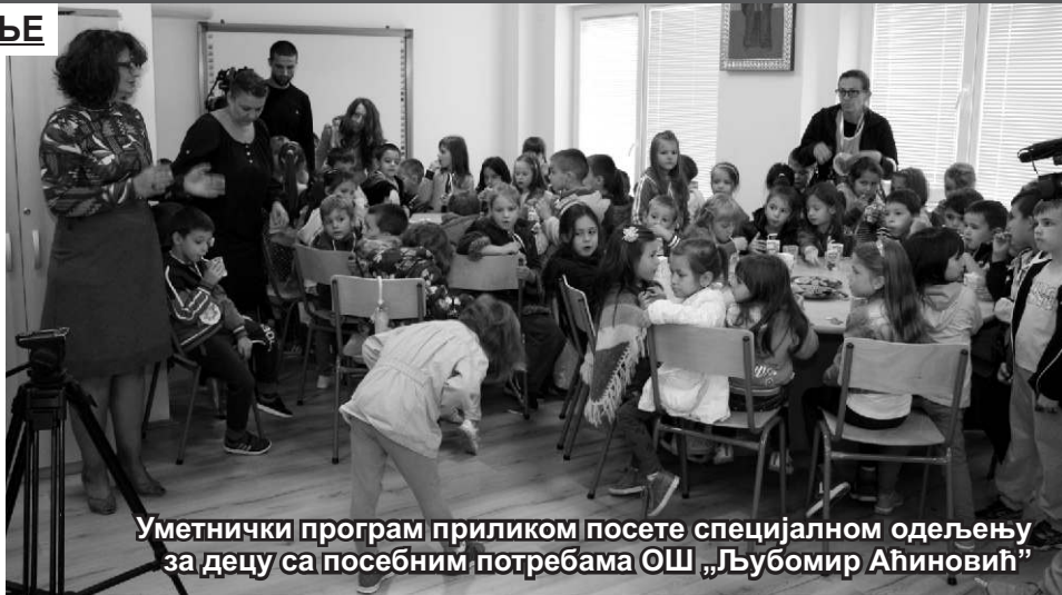
Уметнички програм приликом посете специјалном одељењу за децу са посебним потребама ОШ „Љубомир Аћимовић”

Предшколска установа „Уб“, понудила је својим малишанима различите садржаје, па су у понедељак, 3. октобра, три старије групе посетиле Градску библиотеку „Божидар Кнежевић“, група припремног четворочасовног програма из Уба отишла у госте Музичкој школи „Петар Стојановић“, а предшколске групе целодневног боравка у Основну школу „Љубомир Аћимовић“.