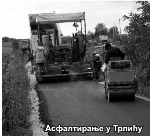
Асфалтирање у Трлићу

ка Каленићу и центру Бргула, чију ће реконструкцију такође финансирати ЕПС, односно огранак ТЕНТ-а „Железнички транспорт“.